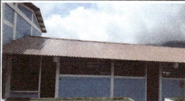
Foto1: Instalación de lámina troquelada y mantenimiento de estructura de metal